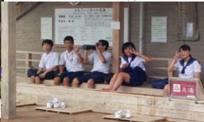
鹿児島市内「ドルフィンポート」で足湯中