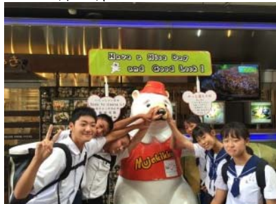
鹿児島市内「天文館むじゃき」で、班別自主活動中です