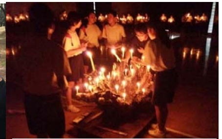
思い出に残るキャンドルのつどい...