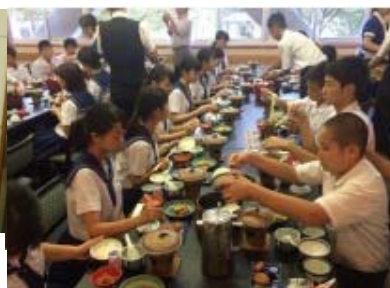
中原別荘で朝食の様子 おいしい料理に舌鼓