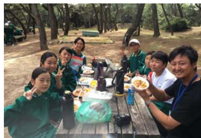
悪戦苦闘をしながら作りあげた夕食は?味も格別なカレーライス!

臨みました。カッターは大きくて、みんなで力を合わせないとカッターがなかなか進みませんが、大きな声を出しながら心をつなげて、みんなでオールを漕いでいました。ま