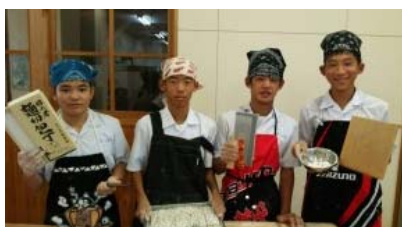
コース別体験活動：初めてのそば打ち体験

那珂川北中学校のホームページでも紹介していましたように、生徒達はこの修学旅行を通じて、学級や学年の仲間との心の絆を深め、相手に対する思いやりの心を大切に、行動につなげていけたと思います。ぜひこの経験を、これからの学校生活にも活かしてほしいと願っています。そして、文化祭・合唱コンクールの取り組みを充実させ、生徒会を創り上げていく学年へと成長していくことを期待しています。