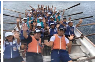
カッター訓練:みんなで力を合わせて漕ぎました